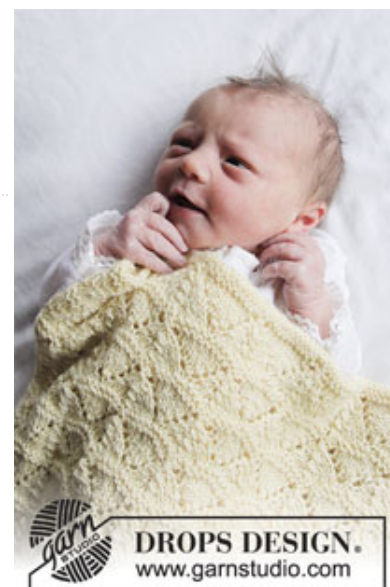
DROPS Baby 33-16

Garnforbrug ved alternativt garn – Brug vores garn-omregner her